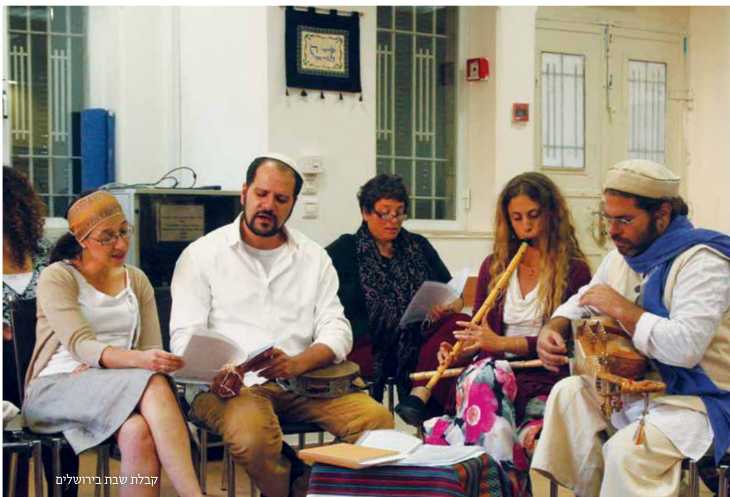
קבלת שבת בירושלים