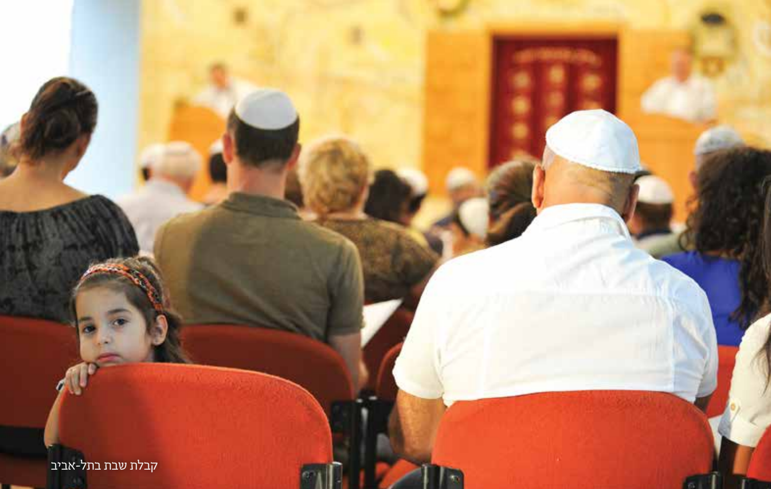
קבלת שבת בתל-אביב